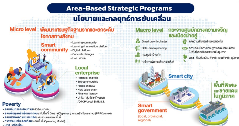
ภาพที่ 1 ยุทธศาสตร์การขับเคลื่อนงานวิจัยเพื่อพัฒนาพื้นที่และลดความเหลื่อมล้ำ หน่วย บพท.

(2) มิติการกระจายศูนย์กลางความเจริญ มีกลุ่มเป้าหมายการพัฒนา คือ เมือง ท้องถิ่น จังหวัดและภูมิภาค ซึ่งเป็นการพัฒนาเชิงโครงสร้างและการจัดการ “ระดับเมือง” เพื่อดึงความเจริญทางเศรษฐกิจภายในจังหวัด สร้างกลไกพัฒนาพื้นที่ให้กับหน่วยงานระดับท้องถิ่น (Local Government) ผ่านผู้ว่าราชการจังหวัด เพื่อสร้างความเข้มแข็งให้กับหน่วยงานระดับตำบลและเทศบาล รวมถึงการจัดการเรื่องเฉพาะกิจในพื้นที่เฉพาะ เช่น พื้นที่เศรษฐกิจพิเศษ พื้นที่พรมแดนและพื้นที่ชายแดนใต้