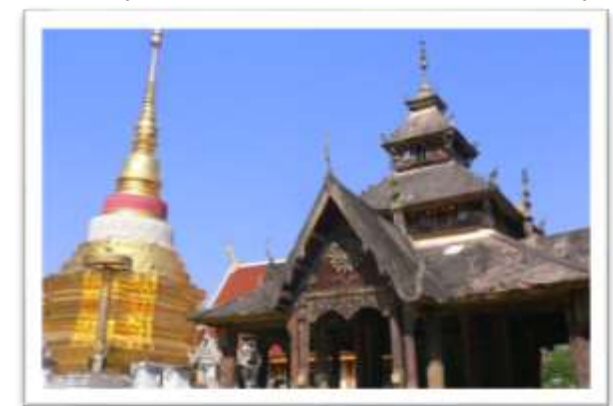
“วิหารพระเจ้าพันองค์” ก่อนได้รับการบูรณะ และขึ้นทะเบียนจาก UNESCO สร้างครั้งแรกในสมัยครูบาอาโน เมื่อปี พ.ศ.2429

สำหรับเหตุการณ์ที่เกี่ยวกับบ้านเมืองท่านครูบาได้จดบันทึกเหตุการณ์สำคัญของเมืองลำปางไว้ด้วยกันหลายครั้ง ดังเช่น เหตุการณ์ครั้งเจ้าหอคำดวงทิพย์ได้ทำการย้ายเมืองจากปากตะวันตกของแม่น้ำวังอันมีวัดปางสนุกเป็นศูนย์กลางของเมือง ข้ามปากไปอยู่ฝั่งตะวันออก ซึ่งเป็นบริเวณเมืองลำปางในปัจจุบันมีวัดบุญญาวิทยาร ในวันเสาร์ ขึ้น 4 ค่ำ เดือน 8 เหนือ ปี จ.ศ.1179 (พ.ศ.2360) และสร้างตลาดเพื่อให้ชาวเมืองได้จับจ่ายซื้อของในวันเสาร์ ขึ้น 15 ค่ำ เดือน 6 เหนือ ในปี จ.ศ.1221 (พ.ศ.2402) มีการก่อสร้างสะพานรัชฎา เมื่อทำการก่อสร้างเสร็จเรียบร้อยแล้ว ยังมีการถวายทานสะพาน ซึ่งเป็นประเพณีของชาวล้านนา เมื่อก่อสร้างสิ่งใดอันก่อให้เกิดประโยชน์ต่อผู้คนในสังคมส่วนใหญ่ ก็มักจะมีการทำบุญถวายทานก่อนที่จะมีการใช้สอย จากบันทึกในใบปลิวของท่านครูบาอาโน ทำให้คนรุ่นหลังได้ศึกษาเกร็ดข้อมูลประวัติศาสตร์ท้องถิ่น ที่ได้บันทึกในช่วงเหตุการณ์สมัยนั้น ถือว่าได้ข้อมูลชั้นต้นที่มีความน่าเชื่อถือ ซึ่งเป็นประโยชน์แก่ผู้ที่สนใจศึกษาประวัติศาสตร์ท้องถิ่นเมืองลำปางได้เป็นอย่างดี