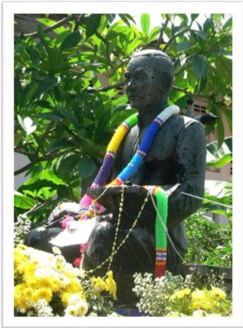
พระยาพรหมโวหาร กวีเอกแห่งล้านนา ผู้ที่แต่งคำสี่บทและคำชมพระยาพรหมโวหาร