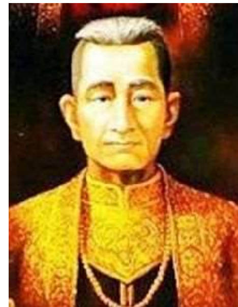
เจ้าฟ้าสิงหาราชธานี (เจ้าฟ้าหลวงชายแก้ว)

เมื่อสังหารทหารพม่าแล้ว พญาจำบ้านก็รีบเดินทางไปเฝ้าพระเจ้าตากสินยังกรุงธนบุรี กราบบังคมทูลขอกองทัพมารบกับพม่า สมเด็จพระเจ้าตากสินจึงโปรดฯให้ พระยาจักรีกับเจ้าพระยาสุรสีห์ ทหารเสือสองพี่น้อง เป็นแม่ทัพคุมพลขึ้นมาถึงเมืองเถิน แล้วแบ่งกำลังออกเป็น 2 กอง ให้พญาจำบ้านคุมกองทัพห้าพันคนยกไปยังเมืองเชียงใหม่ ส่วนทัพหลวงมุ่งหน้าเข้ายึดเมืองลำปาง เมื่อโปมะยง่วนทราบเหตุร้ายจึงเรียกพลเท่าที่มีอยู่ออกสู้รบกับกำลังของพญาจำบ้าน ที่บริเวณบ้านท่าวังตาลทิศใต้ของเชียงใหม่จนพญาจำบ้านปราศยล่ถอยหนีไปรวมกำลังรอกองทัพหลวง ฝ่ายเจ้ากาวิละและน้องๆต่างก็เป็นหัวเจ้าฟ้าชายแก้วพระบิดา ซึ่งยังติดอยู่ที่เมืองเชียงใหม่ไม่รู้จะช่วยอย่างไร ได้แต่มอบให้เจ้าคำสมผู้น้องคุมพลออกมารับหน้าทัพหลวงจากกรุงธนบุรี กองทัพของเจ้าคำสมเคลื่อนออกจากเมืองลำปาง เจ้ากาวิละกับพวกก็ลงมือฆ่าทหารพม่าในเมืองลำปาง ความทราบถึงโปมะยง่วนเห็นท่าไม่ได้การจึงได้จับตัวเจ้าฟ้าชายแก้วคุมขังไว้ พวกเจ้าน้องของเจ้ากาวิละออกอุบายนำเครื่องราชบรรณาการรีบไปให้โปมะยง่วน พร้อมกับอ้างเหตุผลว่า การที่เจ้ากาวิละฆ่าทหารพม่าล้มตายนั่นก็เพราะเกิดสติวิปริต คลุ้มคลั่ง หาใช่จะคิดกบฏไม่ จึงขอความกรุณาไว้ชีวิตเจ้าฟ้าชายแก้ว เจ้ากาวิละเห็นเป็นโอกาสจึงคุมพลสมทบกับกองทัพหลวงรีบยกมาตีเมืองเชียงใหม่พร้อมกับกองทัพของพญาจำบ้านที่รออยู่ บุกเข้าตีเมืองเชียงใหม่จนกองทัพพม่าแตกพ่ายหนีออกไปจากเมืองเชียงใหม่ได้ จากนั้นจึงรีบปลดปล่อยเจ้าฟ้าชายแก้วออกจากที่คุมขัง หลังจากจัดการกับพม่าได้กองทัพจากกรุงธนบุรีก็เดินทางกลับ เจ้าฟ้าชายแก้วก็กลับคืนสู่เมืองลำปางและเนื่องจากท่านชรามากแล้วจึงแต่งตั้งเจ้ากาวิละขึ้นบริหารบ้านเมืองแทน ส่วนทางเชียงใหม่ก็ให้พญาจำบ้านเป็นพ่อเมือง