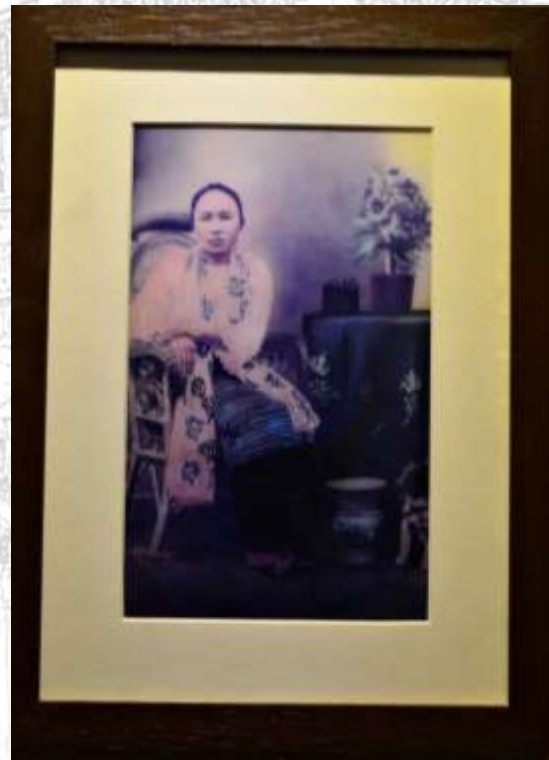
แม่เลี้ยงป้อม บริบูรณ์