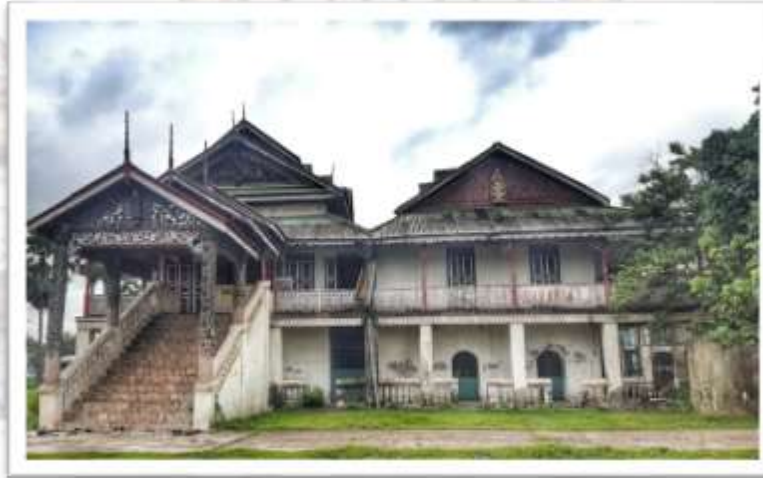
วัดไชยมงคล (จองคา) วัดที่ได้รับการอุปฐากโดยตระกูลสุวรรณอรรถ