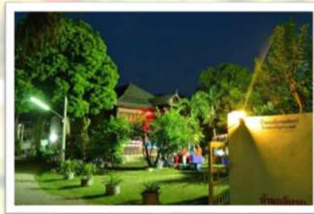
บ้านวงศ์พรหมมินทร์ (ปัจจุบันถูกรื้อถอนแล้ว)