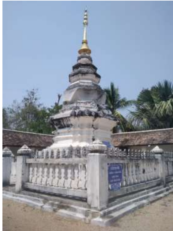
พระเจดีย์ บรรจุพระบรมสารีริกธาตุ