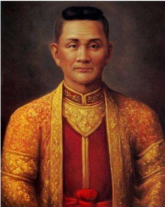
พระเจ้ากาวิละ หรือ (พระบรมราชาธิบดี)

พระบรมราชาธิบดี หรือ พระเจ้ากาวิละ (พ.ศ. 2285 — พ.ศ. 2358) เป็นพระเจ้าผู้ครองนครลำปางพระองค์ที่ 3 และเป็นพระเจ้านครเชียงใหม่พระองค์แรกแห่งราชวงศ์ทิพย์จักร ปกครองดินแดนล้านนาไท 57 เมือง ตลอดรัชสมัยของพระองค์เป็นช่วงเวลาแห่งการศึกสงครามและสร้างบ้านแปงเมือง ทรงเป็นกษัตริย์ชาตินักรบได้ทรงร่วมกับพระอนุชาทั้ง 6 และกองทัพสมเด็จพระเจ้ากรุงธนบุรี กอบกู้อิสรภาพแผ่นดินล้านนาออกจากพม่า และนำล้านนาเข้ามาเป็นประเทศราชแห่งสยาม ด้วยพระปรีชาสามารถและพระเดชานุภาพในการรบ ทรงสามารถขยายขอบเขตอาณาแผ่นดินล้านนาออกไปอย่างกว้างใหญ่ไพศาล กอปรกับความจงรักภักดีที่ทรงถวายต่อพระบรมราชวงศ์จักรี ในวันที่ 14 กันยายน พ.ศ. 2345 พระบาทสมเด็จพระพุทธยอดฟ้าจุฬาโลกมหาราช จึงพระกรุณาโปรดเกล้าฯ ให้จัดพิธีมุทธาภิเษกและสถาปนาพระยาวชิรปราการขึ้นเป็น พระบรมราชาธิบดี ศรีสุริยวงศ์อินทสุรศักดิ์ สมญามหาชัตติยราชชาติราไชยสวรรค์ เจ้าฉันทเสมาพระนครเชียงใหม่ราชธานี มีพระอิสริยยศพระเจ้าเชียงใหม่ เป็นใหญ่ในล้านนาไท 57 เมือง ได้แก่ นครเชียงใหม่ และหัวเมืองเหนือทั้งหมด ในการนี้มีมหรสมโภช 7 วัน 7 คืน