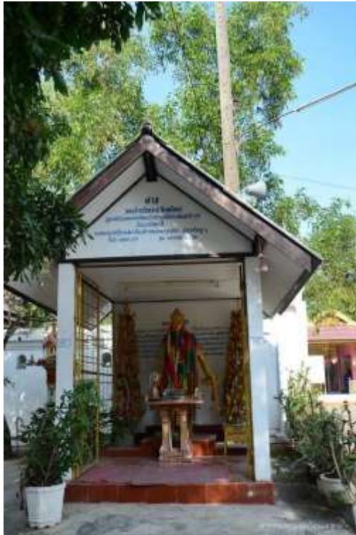
ศาลพระเจ้านันทยศ (อินทเกิงกร) ปฐมกษัตริย์ผู้ครองเขลางค์นคร ในสมัยหริภุญชัย ตั้งอยู่บริเวณประตูทางเข้าวัดพระเจ้าทันใจ