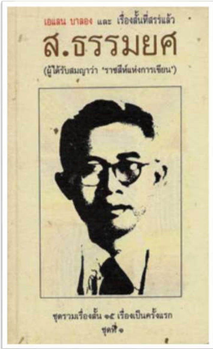
ส.ธรรมยศ หรือชื่อเต็ม แส่น ธรรมยศ นักคิดและนักปรัชญา ชาวลำปาง