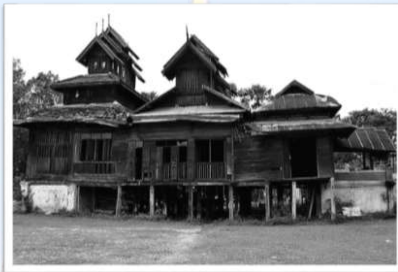
จองหลังเก่าของวัดม่อนจำศีล ก่อนจะได้รับการ บูรณปฏิสังขรณ์ ในปี พ.ศ.2562