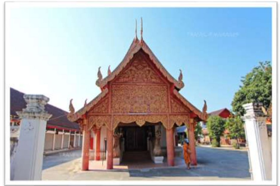
วัดแสงเมืองมา สถานที่จำพรรษาของพระมหาญาณคัมภีร์ เมื่อครั้งมาเผยแพร่นิกายป่าแดงในนครลำปาง จากการนิมนตร์ของพระยาหลวงเมืองลำปาง ในปี พ.ศ.1992 ที่มา : MGR Online เผยแพร่ 18 พฤษภาคม พ.ศ. 2560

ศิษยานุศิษย์ที่ติดตามมาได้ทำการประชุมเพลิงสรีระร่าง จากนั้นนำอัฐิธาตุของท่านมาบรรจุไว้ในเจดีย์บนภูเขาสูงหนึ่ง ในอดีตเรียกว่า “ดอยเก็ง” เนื่องจากเป็นดอยที่มีดอยอื่นๆ ล้อมรอบหมด สถานที่บรรจุธาตุของพระญาณคัมภีร์จึงมีชื่อเรียก 2 แบบ คือพระธาตุดอยเก็ง แต่ไม่เป็นที่นิยมเท่ากับ “พระธาตุญาณคัมภีร์” ในที่สุดวัดเปลี่ยนชื่อใหม่ตามหมู่บ้าน กลายเป็นวัดบ้านขาม ตั้งอยู่หมู่ที่ 1 ตำบลหัวเมือง อำเภอเมืองปาน เจดีย์องค์ดั้งเดิมที่บรรจุอัฐิพระมหาญาณคัมภีร์นั้นก่อเป็นอิฐแบบง่ายๆ มีขนาดเล็ก จนกระทั่งปี พ.ศ.2472 ครูบาเจ้าศรีวิชัยได้เดินทางมายังวัดแห่งนี้โดยนิมิต เนื่องจากท่านสืบแนวทางการปฏิบัติวิปัสสนากัมมัฏฐานมาจากครูบาอาจารย์หลายรูปในสายอริยวาสีที่เดินตามรอยนิกายป่าแดงของพระญาณคัมภีร์ ท่านจึงสร้างครอบใหม่ด้วยรูปแบบเจดีย์ทรงกลมล้านนาอยู่บนฐานยกเก็จ ดังที่เห็นในปัจจุบัน