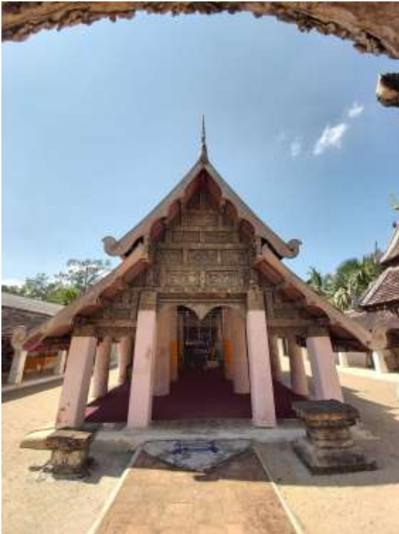
พระวิหาร วัดโหล่หลวง หรือวัดเศ็ลารัตนปัฟตาราม

กรณีความสัมพันธ์ของวัดพระธาตุเสด็จ วัดโหล่หินหลวงแก้วช้างยืนและวัดพระธาตุลำปางหลวง เกิดจากความสัมพันธ์ในตัวบุคคลเป็นหลัก ตามบันทึกได้กล่าวถึงสมัยที่พม่าปกครองล้านนา ที่นครลำปางมีพระมหาปา(พระในตระกูลอรุณวาสี) 2 รูป เป็นพี่น้องกัน คือพระมหาปาเกสระปัญโญองค์ที่ จำพรรษาวัดโหล่หินหลวงแก้วช้างยืน และพระมหาปัญญาองค์น้อง จำพรรษาวัดพระธาตุลำปางหลวง องค์น้องเคยบวชเรียนอยู่วัดพระธาตุเสด็จ และพระมหาปาองค์พี่บวชเรียนที่วัดป่าซางดอยเชียงเมืองลำพูน ทั้งคู่กลับมาเป็นเจ้าของาวาสวัดดังกล่าวแล้วก็ได้เป็นต้นแบบหรือ “เค้าครู” ถ่ายทอดรูปแบบศิลปกรรมและพระธรรมให้กับวัดในลำปางยุคนี้ ในขณะนั้นประกอบด้วยวัดโหล่หินหลวงแก้วช้างยืน วัดพระธาตุลำปางหลวง วัดลำปางกลาง วัดปงยางคก วัดพระธาตุเสด็จ เป็นต้น นอกจากนี้ ยังมีลูกศิษย์ต่างเมือง คือ ขุนด่านสุตตา เจ้าเมืองเถินที่ได้รับการถ่ายทอดรูปแบบงานศิลปกรรมไปยังเมืองเถิน จะสังเกตเห็นว่า ความสัมพันธ์ของพระมหาปาและศิษย์สำนักครูเดียวกันนั้น เป็นหนึ่งในมูลเหตุให้เกิดการเปลี่ยนถ่ายช่างฝีมือและการหยิบยืมแบบแผนในการสร้างงานศิลปกรรมในยุคนี้มาก จากกรณีกลุ่มวัดดังกล่าวนี้ ทั้งวัดพระธาตุเสด็จ วัดโหล่หินแก้วช้างยืน วัดป่าต้นหลวง วัดเวียงเถิน วัดล้อมแรด ทำให้มีการสร้างซุ้มประตูโขงในยุคสมัย รูปแบบ และคติการสร้างที่คล้ายๆกัน โดยอาจจะเป็นการใช้ตำรา สูตรช่าง ในรูปของอิทธิพลร่วมกันในช่วง 2 ศตวรรษนี้ (ฐาปกรณม์ เกรือระยะ, 2564 : ซุ้มประตูโขงวัดพระธาตุเสด็จ จังหวัดลำปาง)