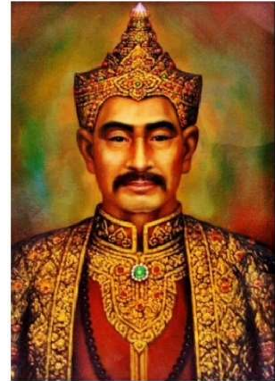
พระเจ้าทิพย์จักรสุลวะลือไชยสงคราม หรือหนานทิพย์ช้าง ต้นราชวงศ์เจ้าเจ็ดตน

บรรดาญาติโยมต่างห้ามปรามท่านไว้ เพราะขณะนั้นหาสงฆ์ดีดัดยากยิ่ง จึงตกลงให้ไปติดต่อท้าวลิ้นก่านที่ตอยประตุม่า ท้าวลิ้นก่านตอบว่ายังไม่พร้อมหากใครจะคิดการณ้อย่างไรก็ทำไปก่อนเถิด ม้าเร็วจึงส่งสารจากท้าวลิ้นก่านไปแจ้งให้ท่านสาธุเจ้าวัดพระแก้วชมพู และชาวบ้านก็ทราบถึงเหตุการณ์นี้จึงนัดประชุมกัน มีชาวบ้านคนหนึ่งเดินได้บอกกับสาธุเจ้าวัดพระแก้วชมพูว่า “อันครุบาเจ้าก็ชำนาญโหราเลขฆานาที่หยังมาคิดค่างยังมีแต่จะสึก ข้าเจ้าคิดว่าลำปางยังบ่เสี้ยงคนดีต่อเจ้า” สวญเจ้าคิดได้จึงลงจับยามสามตลวงเลขฆานาที่ดูอีกสักครั้งจนเห็นว่า “อันหลานกูสามารถยังมีสูฮิบไปตวยมันมาหากูจิมเตอะ” เมื่อหนานทิพย์ช้างได้ไปเข้ากราบสาธุเจ้า วัดพระแก้วชมพู สวญเจ้า จึงได้ถามหนานทิพย์ช้างว่า “บ่าหนาน คิงจะสู้ กูเมืองคินจากพม่าได้ก่อ” หนานทิพย์ช้างจึงได้ตอบกลับไปว่าตอบว่า “อันพม่าหละปูนก็เตียวดิน กินข้าวอย่างหมู่เฮา บมีค้ำหยานกล้วสังเท่าเม็ดงากาตนิก เท่าเวินไว้แต่ดำดินบินบนสิ่งเต้าอัน” สวญเจ้าได้ยินดังนั้นก็รู้สึกภูมิใจในความเด็ดเดี่ยวรักชาติของหนานทิพย์ช้าง เกิดเป็นชายชาติรือกสามศอก ถ้าไม่ปกป้องประเทศชาติก็เสียชาติเกิด จึงได้สถาปนาหนานทิพย์ช้างเป็น “เจ้าทิพย์บุญเรือง” และมอบบริวารให้ประมาณ 300 คน ให้หนานทิพย์ช้างเตรียมตัวไว้ ถ้าได้โอกาสดีเมื่อไหร่ ให้เร่งกู้อิสรภาพคืนจากพม่าลำพูนผู้ให้ได้ โดยมีข้อเสนอและคำมั่นสัญญาจากชาวบ้านชาวเมืองและเจ้าผู้ครองนครองค์เก่าว่า หากทำสำเร็จจะสถาปนาให้เป็นเจ้าครองเมืองลำปางต่อไปดังปรากฏในตำนานพื้นเมืองเชียงใหม่ความว่า