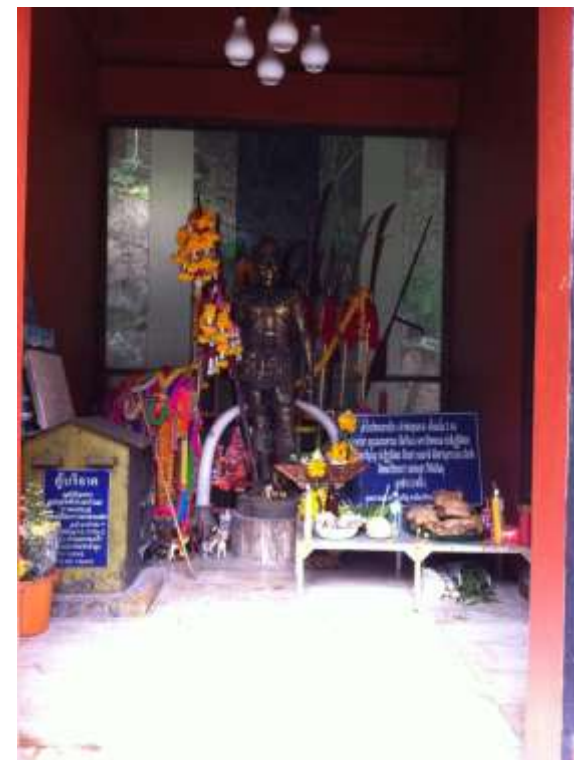
ศาลเจ้าพ่อขุนตาน (พญาเบิก) บริเวณดอยขุนตาน ภายใน ประดิษฐานรูปหล่อสำริดของพญาเบิก

จากประวัติศาสตร์นี้จึงทำให้มีการสร้างอุทยานประวัติศาสตร์เจ้าพ่อขุนตาน (พญาเบิก) ที่ตำบลเวียงตาล อำเภอห้างฉัตร จังหวัดลำปางและสร้างศาลเจ้าพ่อขุนตานในพื้นที่หมู่บ้านห้างฉัตรเหนือ อำเภอห้างฉัตร จังหวัดลำปาง เพื่อเป็นศูนย์กลางทางความเชื่อและความศรัทธารวมถึงเป็นที่พึ่งทางจิตใจของชาวบ้านในอำเภอห้างฉัตร นอกจากสถานที่ทางประวัติศาสตร์แล้วยังมีวัฒนธรรมประเพณีที่เกี่ยวข้องกับเจ้าพ่อขุนตาน เนื่องจากชาวบ้านในอำเภอห้างฉัตร จังหวัดลำปาง มีวัฒนธรรมประเพณีพิธีกรรมที่ยึดเอาเจ้าพ่อขุนตานเป็นศูนย์กลางของชุมชนยังคงรักษาและสืบทอดประเพณีพิธีกรรมต่างๆ ที่เกี่ยวข้องกับเจ้าพ่อขุนตาน ซึ่งบางประเพณีก็ไม่มีมีการประกอบพิธีกรรมหรือประเพณีนี้ที่ไหนอีกแล้วมีแค่ในอำเภอห้างฉัตร ซึ่งประเพณีและพิธีกรรมเหล่านี้ได้มีการสืบทอดกันมาตั้งแต่อดีตจนถึงปัจจุบัน ได้แก่ พิธีกรรมไขประตูดอยเป็นภูมิปัญญาแห่งการจัดการน้ำ พิธีกรรมเลี้ยงห้วยเลี้ยงฮ่องเป็นพิธีกรรมที่เกี่ยวข้องกับสิ่งแวดลอม พิธีกรรมหลงใหม่และวังอี่นาเป็นพิธีกรรมเกี่ยวข้องกับธรรมชาติเป็นภูมิปัญญาแห่งการเก็บน้ำไว้ในฤดูแล้งพิธีแห่ช้างเผือกเป็นการแสดงถึงภูมิปัญญาแห่งการรักษาสิ่งแวดล้อมอย่างอ่อนน้อมถ่อมตนบนความเชื่อความศรัทธามานับหลายร้อยปี