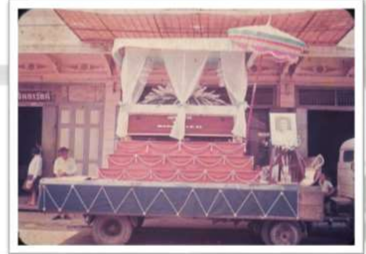
งานศพนางลูกซัด เสาจินดาร์ตัน เมื่อปี พ.ศ.2509 บริเวณหน้าตึกเสาจินดาร์ตัน