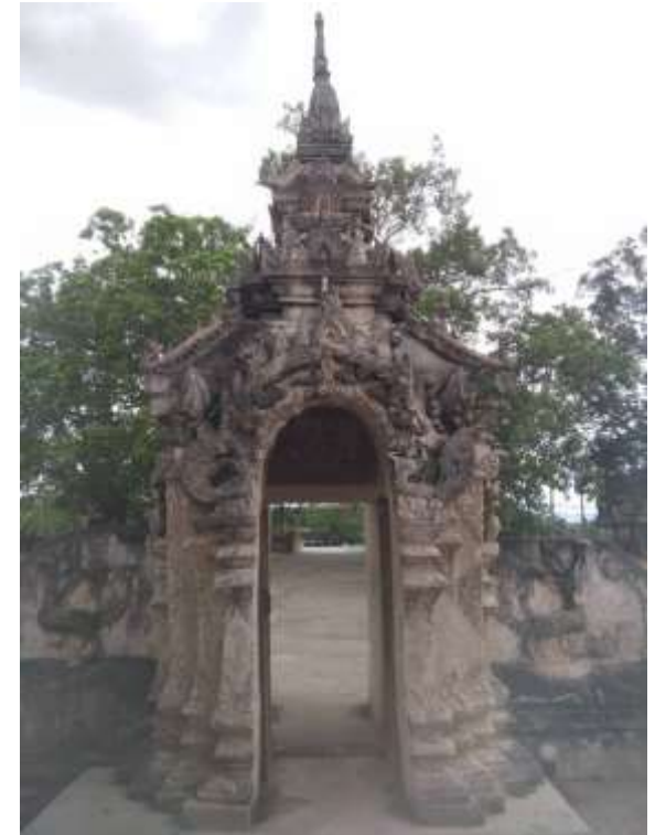
ซุ้มประตูโขง ประดับเซรามิก สักกช่างลำปาง