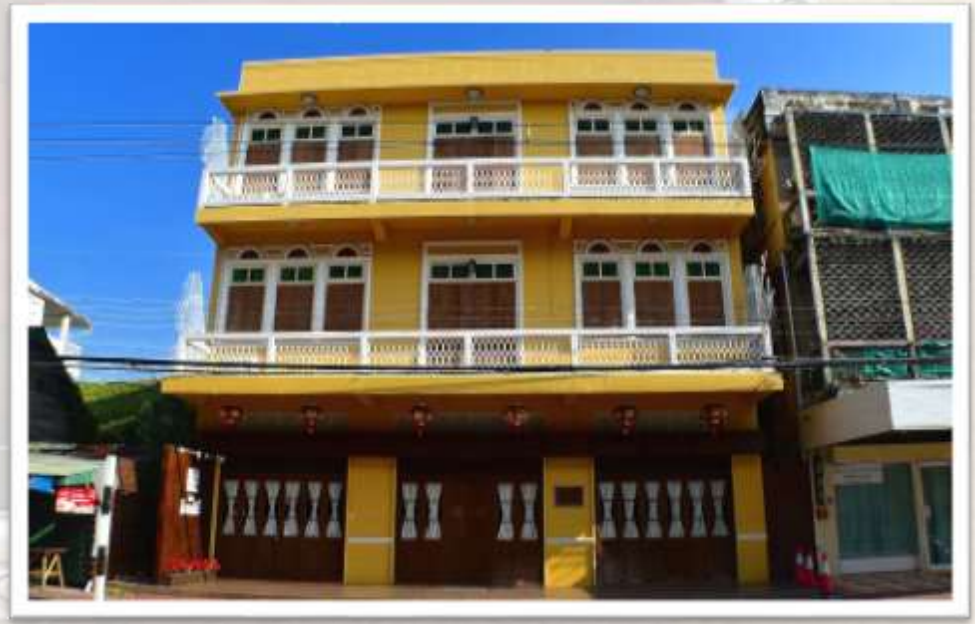
บ้านกิจเสรี หรือ “จิวแซหลี” อดีตร้านขายของส่งที่ใหญ่ที่สุดในเมืองลำปาง