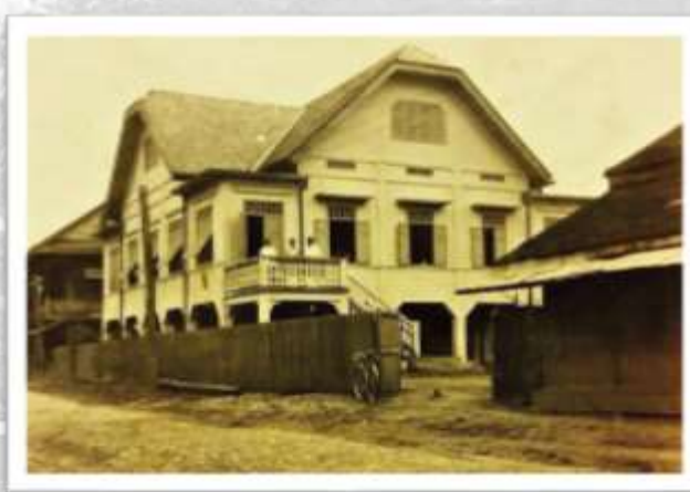
นายน้อย คมนสัน เจ้าของบ้านคมนสัน คนแรก