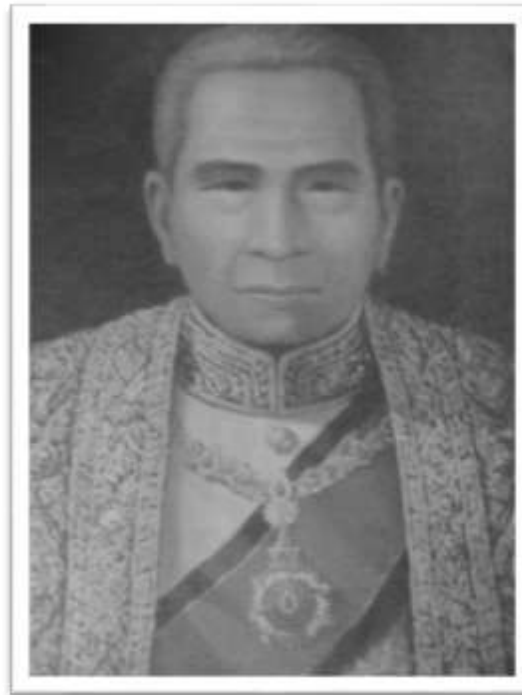
พระยาน้อยอินทร์ เจ้าผู้ครองนครลำปาง องค์ที่ 8

เจ้าหลวงชาติยะ หรือเจ้าคันทิยะ (พ.ศ.2315 – 2381) เจ้าผู้ครองนครลำปาง องค์ที่ 7 ขึ้นครองนครลำปางระหว่างปี พ.ศ. 2380 – 2381 เป็นระยะเวลาสั้นๆเพียง 6 เดือนก็ถึงแก่พิราลัย เจ้าหลวงชาติยะเป็นราชบุตรองค์ที่ 2 ของพระเจ้าคำโสม เจ้าผู้ครองนครลำปางองค์ที่ 4 และเป็นอนุชาในพระยาไชยวงศ์ เจ้าผู้ครองนครลำปาง องค์ที่ 6 เมื่อพระยาไชยวงศ์ถึงแก่พิราลัยลงในปี พ.ศ.2380 เจ้าคันทิยะ ซึ่งในขณะนั้นดำรงตำแหน่งเป็นพระยาชาติยะ อุปราชนครลำปาง ได้เดินทางลงไปเข้าเฝ้าพระบาทสมเด็จพระนั่งเกล้าเจ้าอยู่หัว และได้รับพระกรุณาโปรดเกล้าฯ ตั้งพระยาอุปราชชาติยะ ขึ้นเป็นพระยานครลำปาง ครั้นพระยาชาติยะทราบถวายบังคมลาเดินทางกลับมายังนครลำปางได้เพียง 6 เดือนก็ป่วยถึงแก่พิราลัย พระบาทสมเด็จพระนั่งเกล้าเจ้าอยู่หัว จึงทรงโปรดเกล้าฯ ให้พระยาสุเรนทร์ราชเสนา เป็นผู้แทนพระองค์ขึ้นมาพระราชทานเพลิงศพ