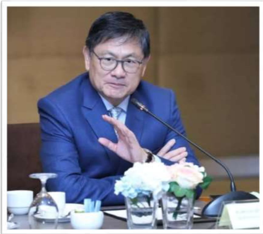
ศาสตราจารย์พิเศษ ดร.เอนก เหล่าธรรมทัศน์ รัฐมนตรีว่าการกระทรวงการอุดมศึกษา วิทยาศาสตร์ วิจัยและนวัตกรรม