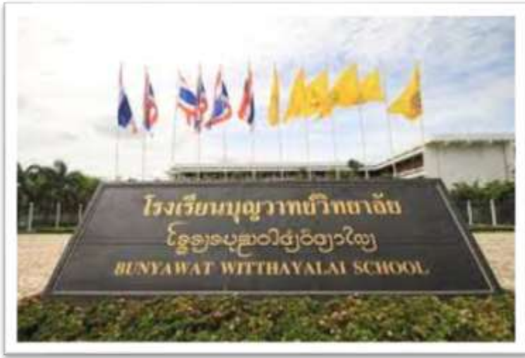
โรงเรียนบุญวาทย์วิทยาลัย ตั้งอยู่ ณ บริเวณสนามเสือป่านครลำปาง (เดิม)

เจ้าบุญวาทย์วงศ์มานิตเล็งเห็นความสำคัญของการศึกษาว่าจำเป็นยิ่งต่อการพัฒนานครลำปาง พระองค์ได้สนับสนุนส่งเจ้านายบุตรหลานและประชาชนลำปาง ที่ทรงคัดเลือกว่ามีสติปัญญาความสามารถไปศึกษาต่อที่กรุงเทพมหานคร โดยให้อยู่ในความดูแลของกระทรวงมหาดไทย ซึ่งบุคคลเหล่านั้นก็ได้กลับมาทำงานสร้างคุณประโยชน์ให้แก่นครลำปางและประเทศชาติหลายท่าน นอกจากนั้น พระองค์ยังได้ทรงสละราชทรัพย์ส่วนพระองค์ซื้อที่ดินและอาคารของห้างเซ่งหลี สร้างโรงเรียนขึ้นอีกแห่งหนึ่งแล้วประทานให้เป็นของรัฐ[10][8] ซึ่งในปี พ.ศ. 2448 พระบาทสมเด็จพระมงกุฎเกล้าเจ้าอยู่หัว ขณะดำรงอิสริยยศเป็นสยามมกุฎราชกุมารได้เสด็จประพาสหัวเมืองฝ่ายเหนือ และทรงพระกรุณาเสด็จทรงเปิดโรงเรียนใหม่แห่งนี้เมื่อวันที่ 26 พฤศจิกายน และพระราชทานนามว่า "โรงเรียนบุญวาทย์วิทยาลัย" เพื่อถวายเป็นพระอนุสรณ์แด่ เจ้าบุญวาทย์วงศ์มานิต