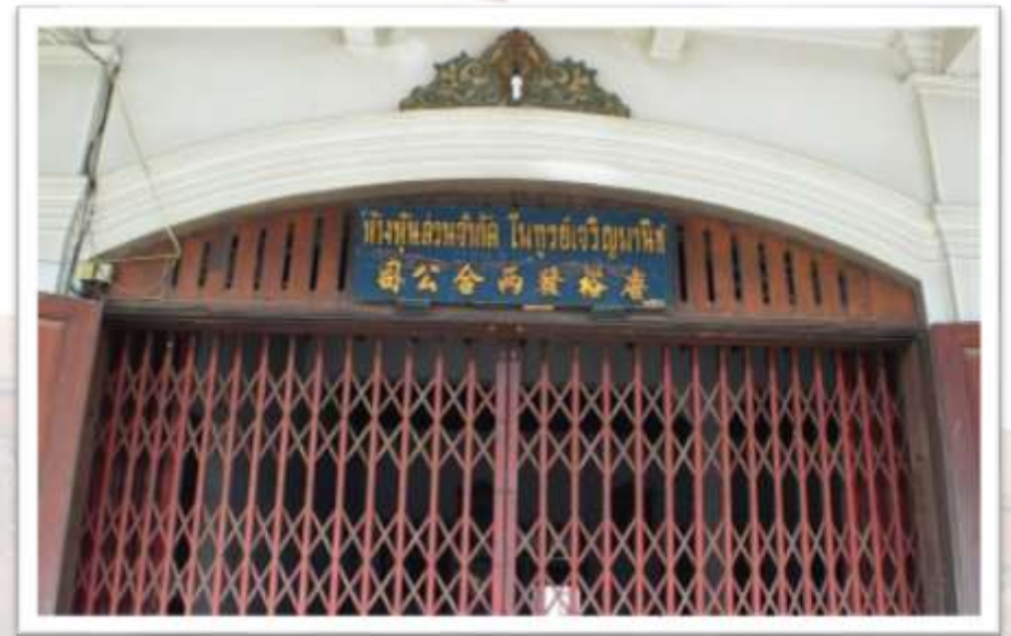
ห้างหุ้นส่วนจำกัด ไพฑูรย์เจริญพานิช

กิจการค้าข้าวหนึ่งในธุรกิจของตระกูล “วิทยานอกอนันต์”