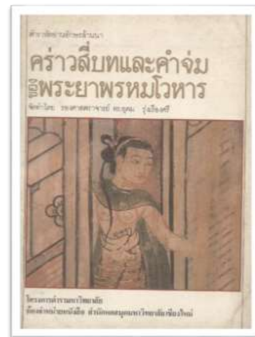
คำวาวสี่บทและคำจ่ม ผลงานด้านกวีนิพนธ์ชิ้นสำคัญของพระยาพรหมโวหาร

เมื่อพระยาพรหมโวหารอายุได้ 60 ปี เจ้าแม่ทิพเกสร มเหสีของเจ้าหลวงกาวิโรรสเชียงใหม่ทรงเรียกพรหมินทร์ให้เข้าสู่สำนักคุ้มหลวงเชียงใหม่ เพื่อตัดแปลงคำกลอนเรื่องพระอภัยมณีเป็นบทกวีคำวาวคำเมือง จนได้รับรางวัลเป็นภรรยาคนสุดท้ายชื่อ “เจ้าบัวจันทร์” มีบุตรชื่อว่า “ซี้หมู” คนเดียว (สงวน โชติสุขรัตน์, ตำนานพื้นเมืองเหนือ. 2508: 307-322.)