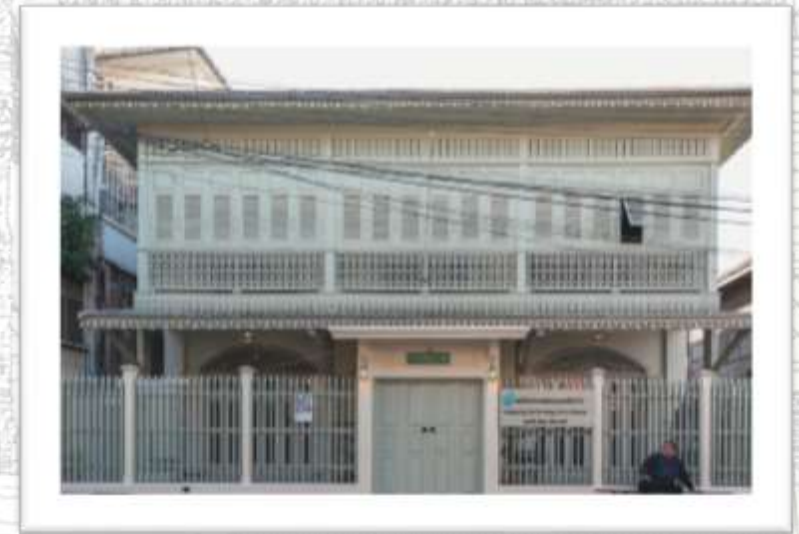
บ้านบริบูรณ์ ปัจจุบันคือหอศิลปะการแสดงนครลำปาง มูลนิธิปทุมเสวี