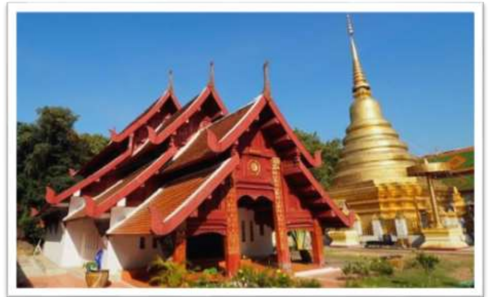
วิหารและพระธาตุเจดีย์ วัดพระธาตุเสด็จ ที่บูรณะในสมัยพระยาคำโสม