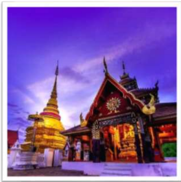
วิหารพระเจ้าพันตนและพระธาตุเจดีย์ วัดปงสนุก ที่บูรณะในสมัยเจ้านรนนท์ไชยขวลิต

แต่ในขณะนั้นรัฐบาลทางกรุงเทพฯ พยายามที่จะปลดเจ้าสุริยะจางวาง ออกจากการเป็นเจ้าผู้ครองนครลำปาง แต่ทว่าเจ้าสุริยะไม่ยอมรับอำนาจการจัดการของรัฐบาลกรุงเทพ และยึดถือตราประจำตำแหน่งไว้ครอบครอง กระนั้นรัฐบาลทางกรุงเทพฯ ก็พยายามสนับสนุนเจ้าอุปราช (นรนนท์ไชย) ให้เป็นเจ้าหลวงอีกพระองค์หนึ่งในเวลาเดียวกัน นับได้ว่าช่วงเวลาดังกล่าวนครลำปาง มีเจ้าหลวง 2 พระองค์ แต่ในบางตำราประวัติศาสตร์กล่าวว่าเจ้าหลวงสุริยะ ลาออกจากตำแหน่งเจ้าผู้ครองนครลำปางในปี พ.ศ. 2430 ครั้นเมื่อปี พ.ศ. 2436 รัฐบาลได้ส่งพระยาทรงสุรเดชขึ้นมาเป็นข้าหลวงมณฑลลาวเฉียง และพระยาทรงสุรเดช ได้เจรจากับเจ้าสุริยะจางวางจนสำเร็จและยอมสละอำนาจดังกล่าว และกับการได้รับเงินปี 3,000-4,000 รูปี