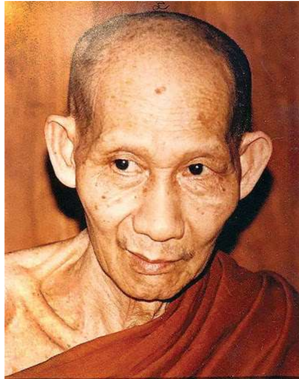
ครูบาเจ้าหลวงพ่อกษม เขมโก

ครูบาเจ้าหลวงพ่อกษม เขมโก เป็นพระสงฆ์ที่มุ่งสู่การปฏิบัติ ได้เจริญกรรมฐาน ปฏิบัติตามรอยพระพุทธองค์ ท่านมีความอดทนต่อสู้กับธรรมชาติ ต่อสู้กับกิเลส และมีเมตตาต่อญาติธรรมประชาชนผู้ทุกข์ยากต่างๆ มากมาย เชื่อกันว่าครูบาเจ้าหลวงพ่อกษม เขมโก ได้ปฏิบัติธรรมอันสืบสืบเอ็ด คือ ทานบารมี อุเบกขาบารมี ศีลบารมี เนกขัมมะบารมี ปัญญาบารมี อิริยะบารมี ขันติบารมี สัจจะบารมี เมตตาบารมี อธิษฐานบารมี และอานิสงสีในการบรรพชา ในระยะต่อมาศิษยานุศิษย์ของหลวงพ่อกษม ได้ตั้งเป็นมูลนิธิการศึกษาของหลวงพ่อกษม เขมโก นำดอกผลที่ได้จากประชาชน ที่ศรัทธาในหลวงพ่อบริจาคหรือบูชาวัตถุมงคลต่างๆ ได้นำไปช่วยองค์กร สถาบันการศึกษาและกลุ่มต่างๆ ตลอดจนคนยากจนเป็นจำนวนมาก อำนวยประโยชน์ให้กับชาวลำปาง อย่างเอนกอนันต์ ปรากฏสิ่งที่เป็นถาวรวัตถุที่มูลนิธิบริจาครวมอยู่ทั่วไปในจังหวัดลำปาง ทั่วไปถือว่าหลวงพ่อกษมเป็นอริยสงฆ์อีกรูปหนึ่งของไทย