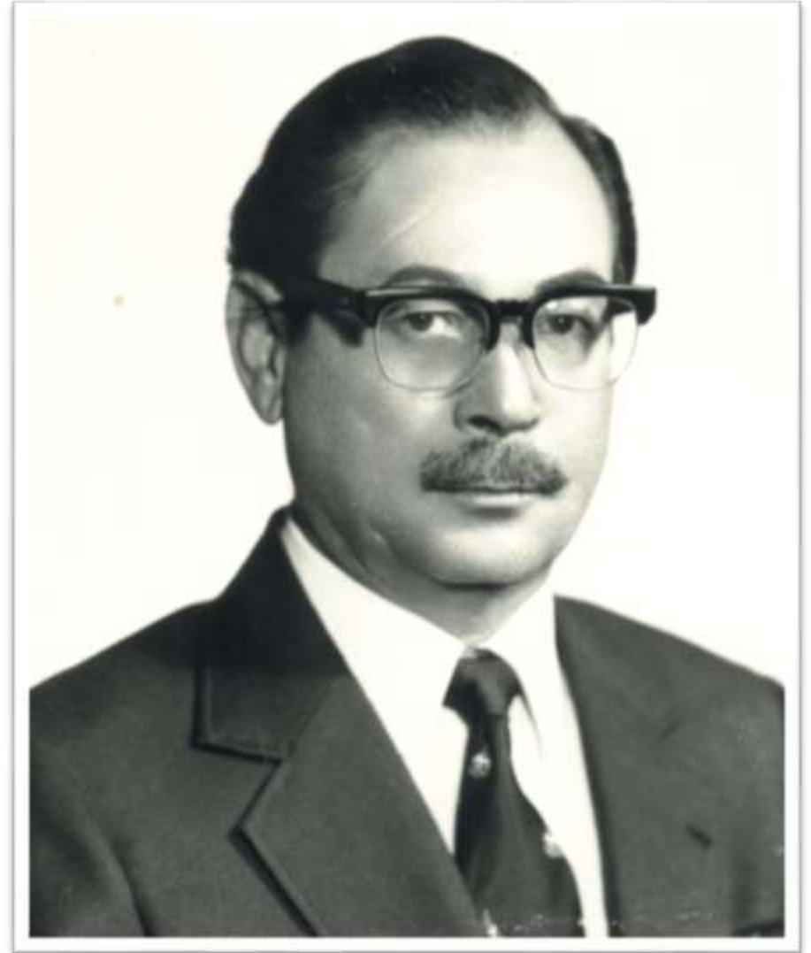
ศาสตราจารย์ นายแพทย์ บุญสม มาร์ติน ผู้ได้รับการยกย่องให้เป็น “บิดาของการพลศึกษาแผนใหม่ของไทย”

ศาสตราจารย์ นายแพทย์ บุญสม มาร์ติน เสียชีวิตด้วยภาวะหัวใจและระบบหายใจล้มเหลว ที่โรงพยาบาลเซนต์หลุยส์ เมื่อวันที่ 9 มิถุนายน พ.ศ. 2551 รวมอายุได้ 85 ปี ศพของท่านฝังตามหลักศาสนาคริสต์นิกายโรมันคาทอลิก ที่สุสานซานติคาม อำเภอสามปราชญ์ จังหวัดนครปฐม เมื่อวันที่ 14 มิถุนายน พ.ศ. 2551